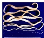
Verme adulto que pode chegar até 10m